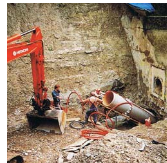
Bauarbeiten am Kraftwerk.