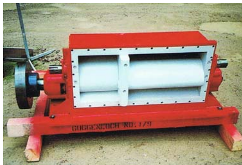
Die 130 kW Turbine vor dem Einbau.