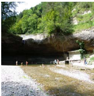
Umgebung des Kraftwerks im Guggenloch.