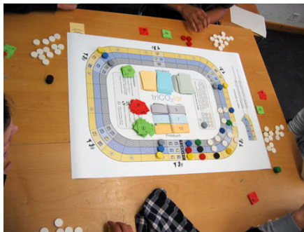
Das Spielbrett der Generationen. Jede Gruppe repräsentiert eine Generation.

Das Planspiel kann ab 12 SpielerInnen gespielt werden und eignet sich für Schulklassen, Jugendgruppen und Anlässe aller Art. Im Unterricht passt es zu Themengebieten wie Wirtschaftslehre, Umwelt, Ökologie oder Soziallehre. Alle Individuen der drei oder mehr Generationen investieren Runde um Runde in fossile, effiziente oder erneuerbare Technologien. Je nach Entscheid und technologischem Fortschritt ändern sich die Voraussetzungen für alle teilnehmenden Generationen.